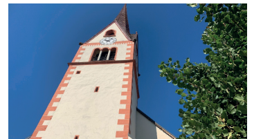
Markuskirche, Bergsteigerdorf Mauthen