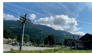
Aquarena / Talstation Vorheggbahn